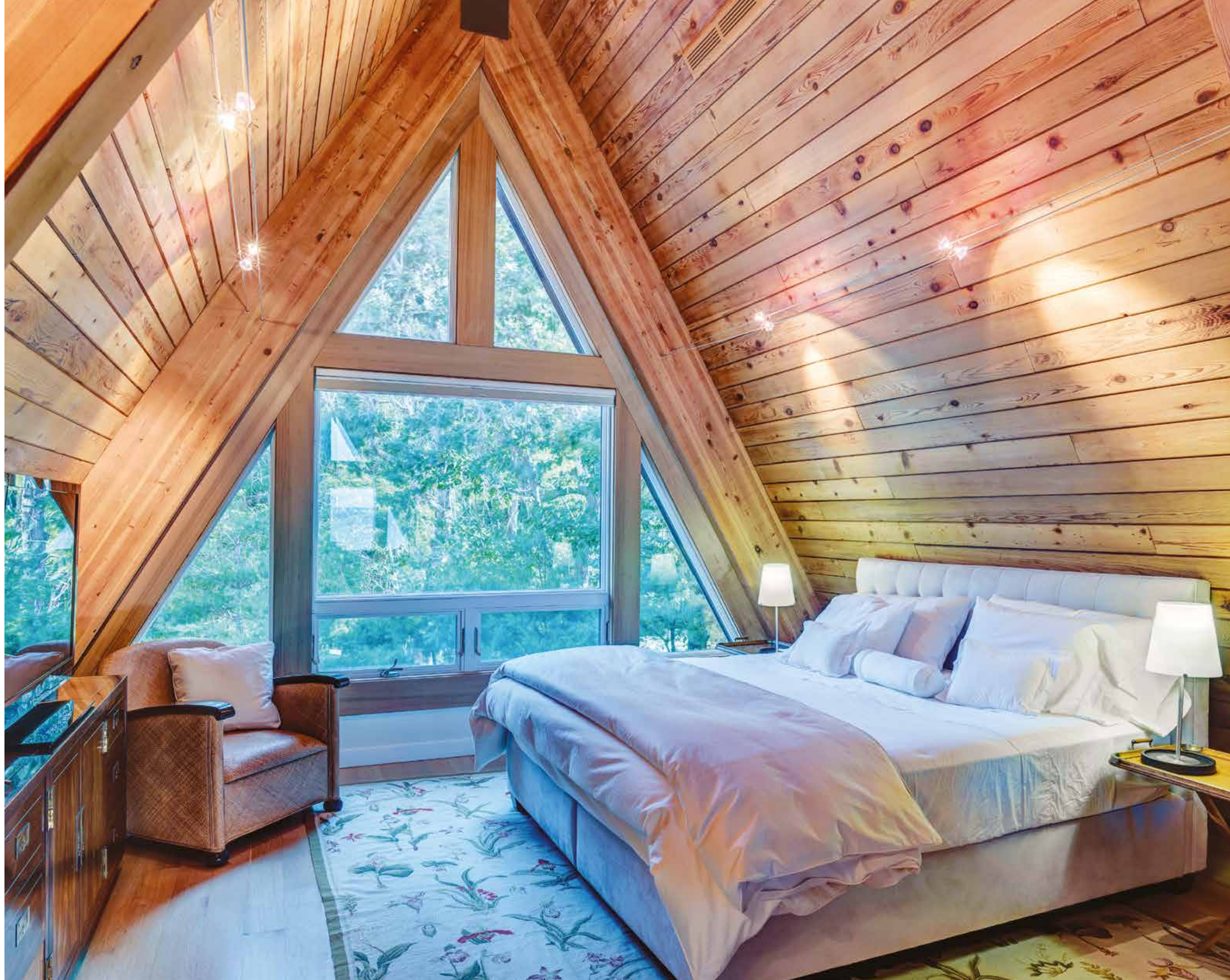
Spettacolare questa camera con vista sul panorama esterno e incorniciata dalle falde spioventi del tetto ligneo. Il letto bianco in pelle su misura by Armonia Interni è completato da un cassettoni e poltrona d'epoca.