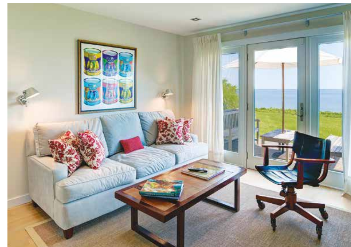
Zona pranzo con vista sull'Oceano arredata con tavolo e sedie in equilibrio con la trasparenza del volume (Armonia Interni). Anche la stanza dedicata al relax gode di una vista spettacolare e di pezzi d'arredo moderni ed eleganti (Armonia Interni).