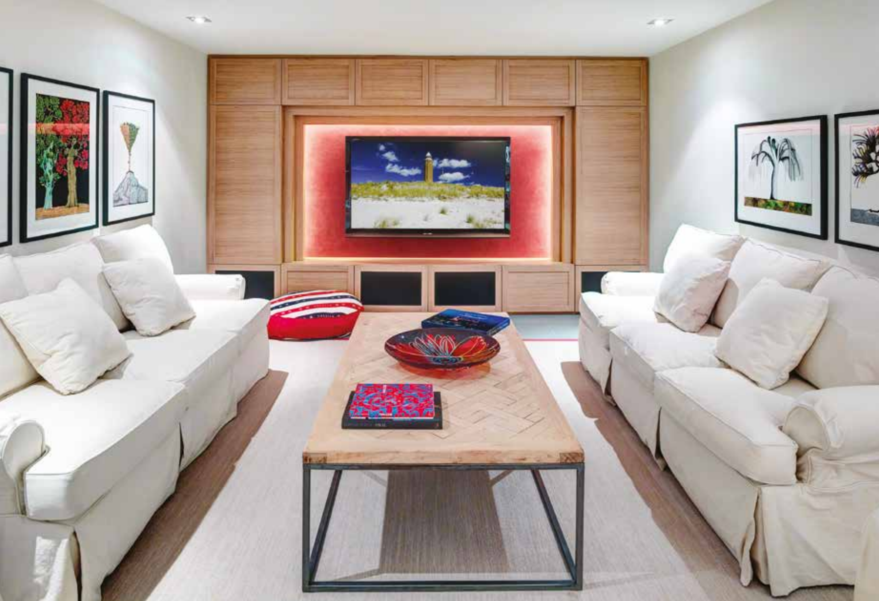
Sopra: sala cinema con una parete di boiserie e vani contenitori disegnata e realizzata su misura da Armonia Interni che ha gestito e realizzato il progetto d'interni. A destra: sala biliardo con libreria bianca a giorno e sistema d'illuminazione integrato. Luci e impianto sono stati curati in tutta l'abitazione da Armonia Interni.