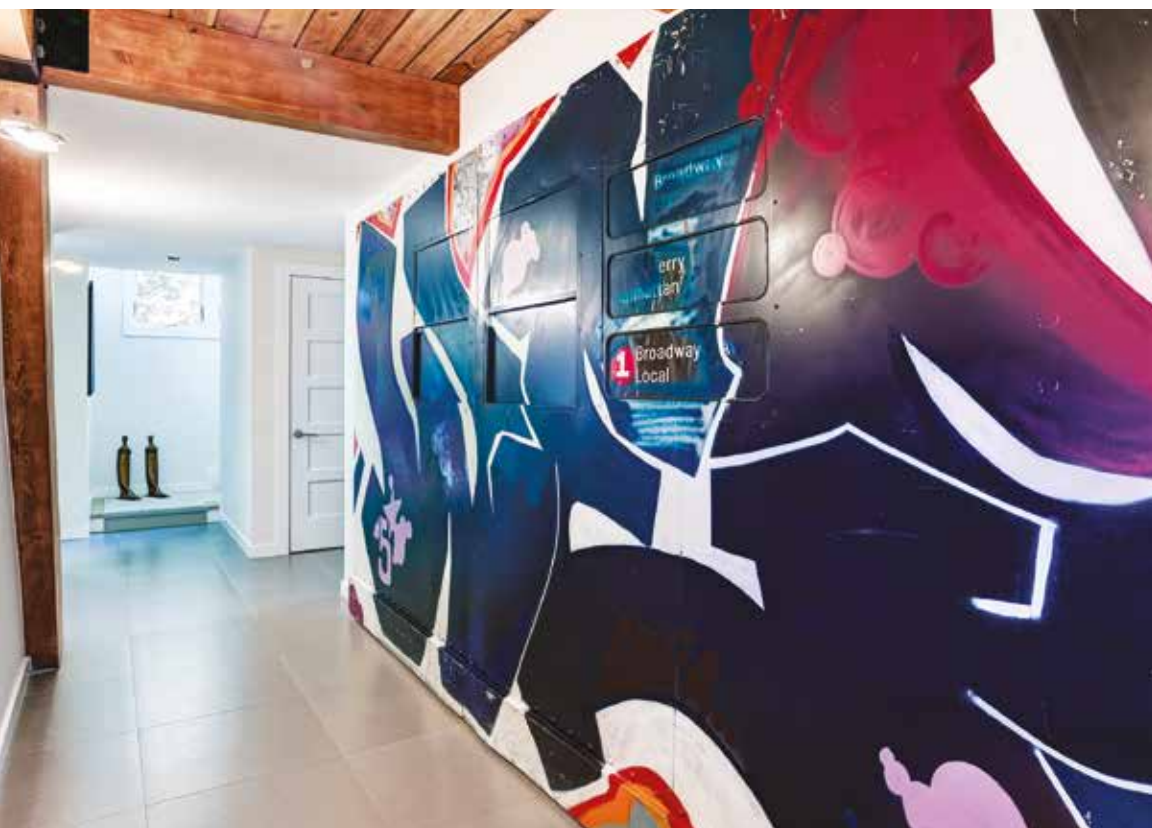
Sopra: il camino, rivestito in mattoni bianchi, diventa un elemento scenografico ed il prospetto posteriore funge da sfondo ad un'opera d'arte. Accanto: la parete del corridoio diventa il posto ideale per far vivere questa importante opera d'arte, che caratterizza la zona di passaggio rendendola dinamica attraverso la forza del colore.